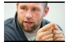
Robert Harting erklärt seine Sportlotterie